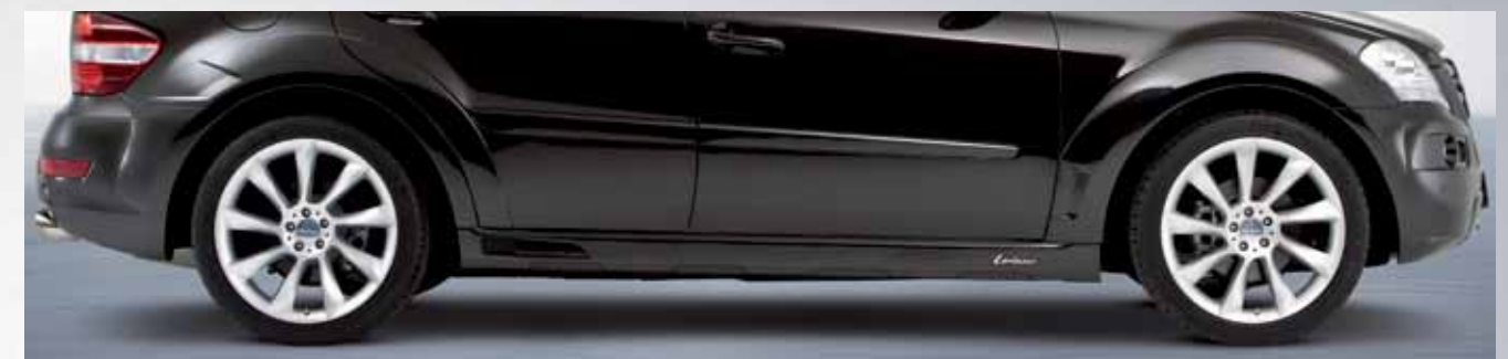
Lorinser-Seitenschweller und Kotflügelverbreiterungssatz Lorinser side skirts and wheel arch widening set