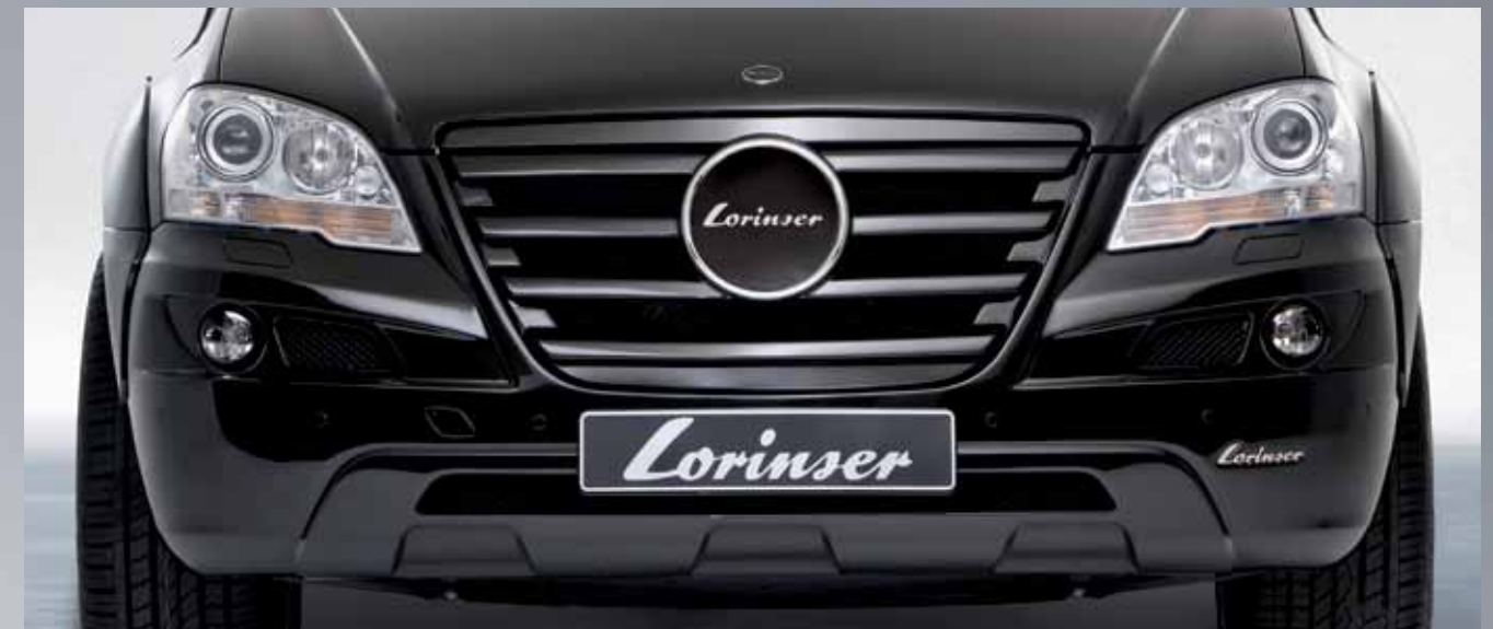
Spoilerstoßfänger und Lorinser Kühlergrill mit vier Lamellen Spoiler bumper and four-bar Lorinser radiator grille