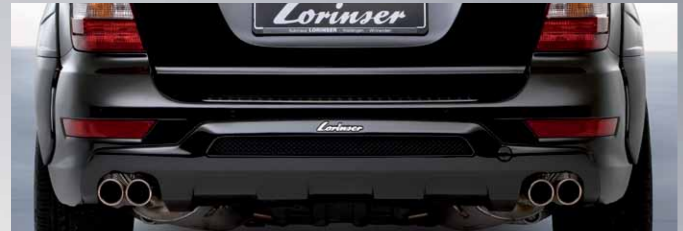
Dynamische Heckschürze mit Sportgitter und Sportauspuff mit zwei Doppelrohr-Endblenden Dynamic rear apron with wide sports rail and sports exhaust with two built-in twin tailpipes