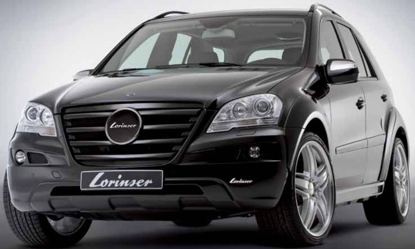
Lorinser M-Klasse Lorinser M-Class