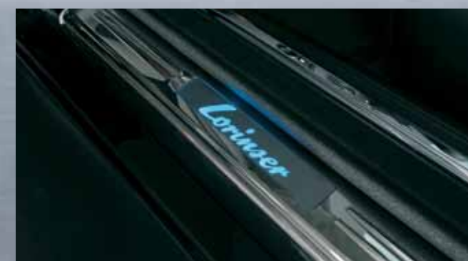
Einstiegsleisten mit beleuchtetem Lorinser-Schriftzug Door sills with illuminated Lorinser logo