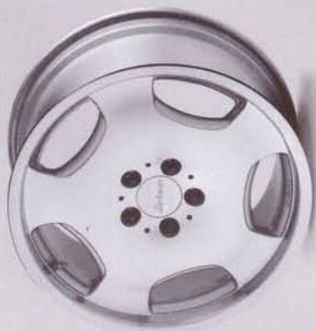
RS 1 poliert/polished Einteiliges Leichtmetallrad/One-piece rim Lieferbare Radgrößen/Available wheel sizes 8 x 18