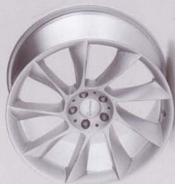
RS 8 silber-lackiert/silver-painted Einteiliges Leichtmetallrad/One-piece rim Lieferbare Radgrößen/Available wheel sizes 9 x 20; 10 x 20