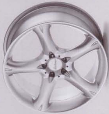
RS 6 silber-lackiert/silver-painted Einteiliges Leichtmetallrad/One-piece rim Lieferbare Radgrößen/Available wheel sizes 8,5 x 18; 9,5 x 18