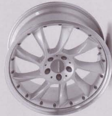
LM 6 silber-lackiert/silver-painted Rand poliert/Edge polished Zweiteiliges Leichtmetallrad/Two-piece rim Lieferbare Radgrößen/Available wheel sizes 8,5 x 19; 9,5 x 19; 9 x 20; 10 x 20