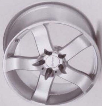
RS 5 poliert/polished Einteiliges Leichtmetallrad/One-piece rim Lieferbare Radgrößen/Available wheel sizes 8,5 x 18; 9,5 x 18; 8,5 x 19; 9,5 x 19