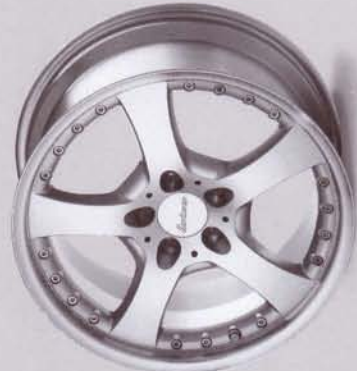
LM 5 silber-lackiert/silver-painted Zweiteiliges Leichtmetallrad/Two-piece rim Lieferbare Radgrößen/Available wheel sizes 8,5 x 18; 9,5 x 18; 8,5 x 19; 9,5 x 19