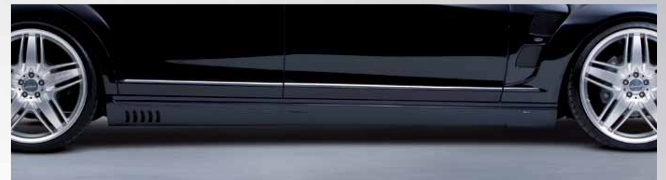
Markante Seitenschweller mit Lorinser-typischen Kiemen als Bindeglied zwischen Front und Heck.