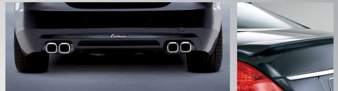
Sportliche Heckpartie mit Lorinser Heckschürze, Sportauspuff mit zwei rechteckigen Doppel-Endrohren und einer harmonisch designten Heckklappe.