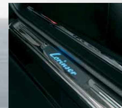
Beleuchtete Türeinstiegsleisten mit Lorinser-Schriftzug. Illuminated doorsill panels with Lorinser logo.

Interieurveredelung: Individuelle Lenkräder, Tacho/Kombiinstrument, Pedalsets verchromt und Alu eloxiert, verchromte Türverriegelungsknöpfe, Komplett-Lederausstattung, Leder-Fußmatten mit gesticktem Lorinser-Emblem.