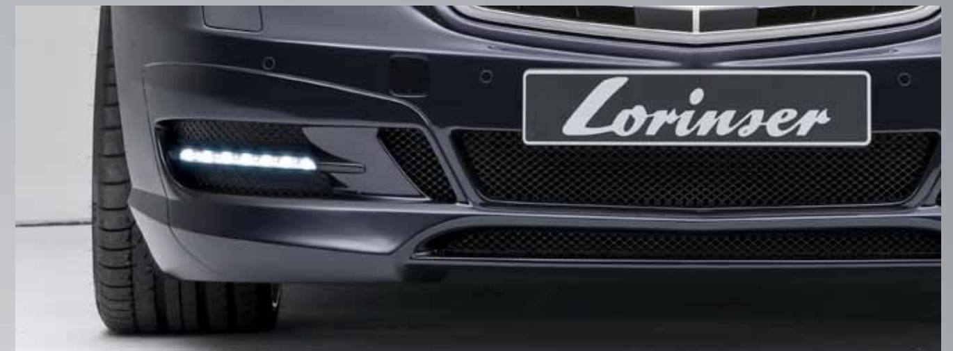
Frisches Frontdesign mit dominantem Spoiler-Stoßfänger und integrierten LED-Tagfahrlichtern.