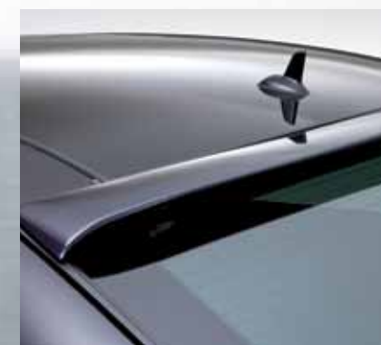
Dynamischer Dachspoiler. Dynamic roof spoiler.